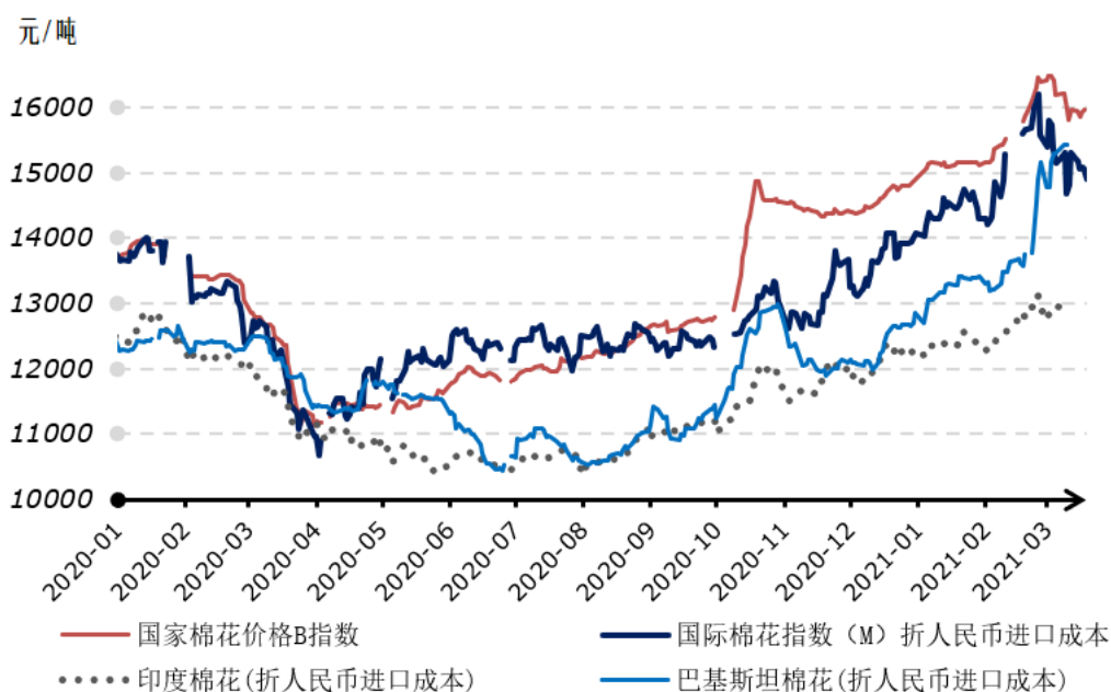
2020年以来国内外棉花现货价格走势