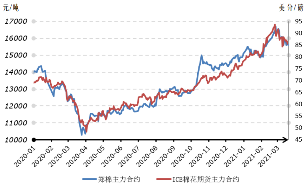
2020年以来国内外棉花期货价格走势对比图