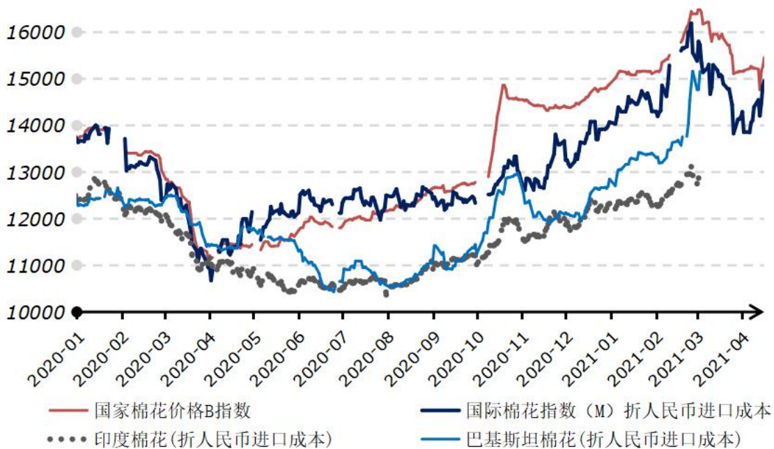
2020年以来国内外棉花现货价格走势