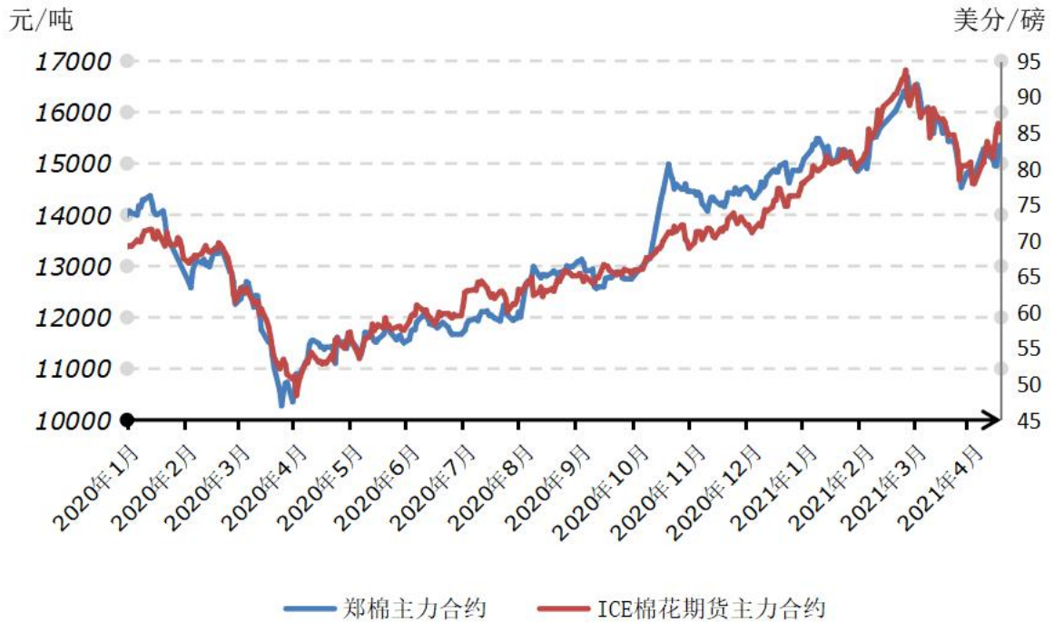
2020 年以来国内外棉花期货价格走势对比图