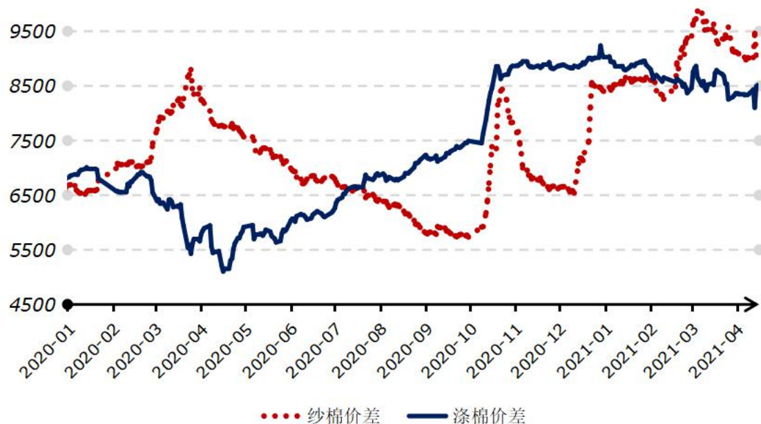
2020 年以来国内纱棉、涤棉价差走势图