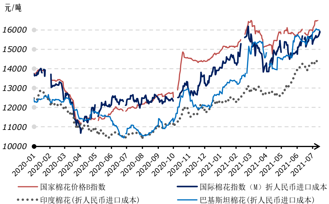
2020年以来国内外棉花现货价格走势