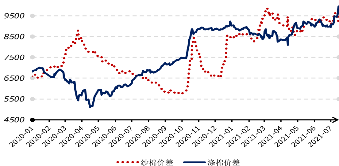
2020 年以来国内纱棉、涤棉价差走势图