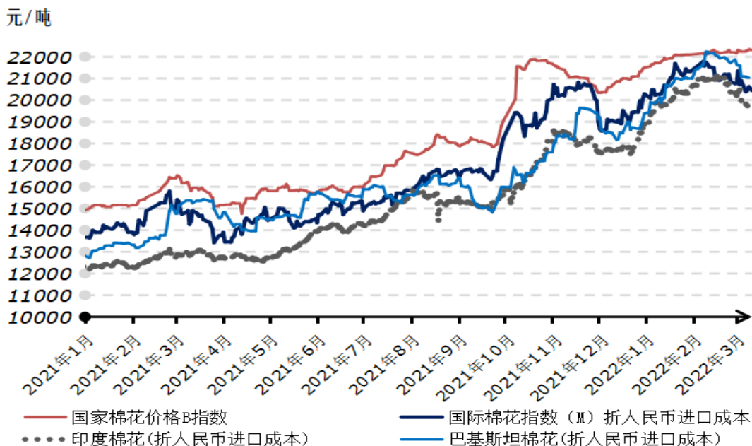
2021年以来国内外棉花现货价格走势