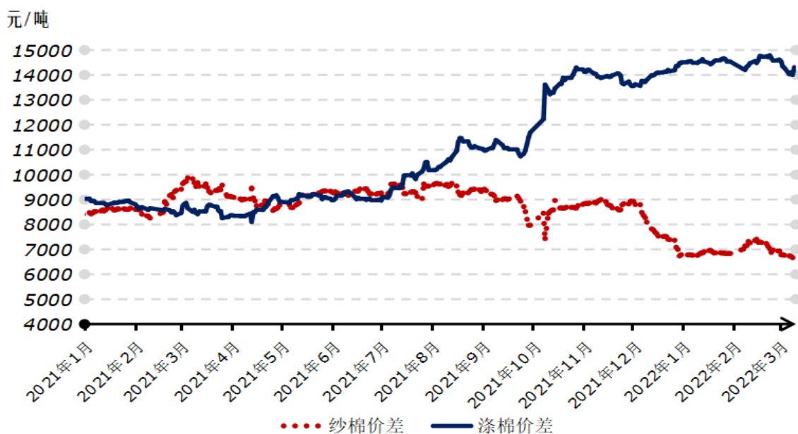
2021年以来国内纱棉、涤棉价差走势图